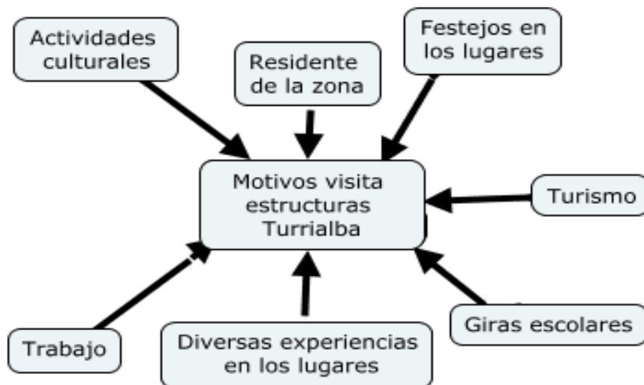
Figura 5. Motivos de Visita Estructuras Turrialba