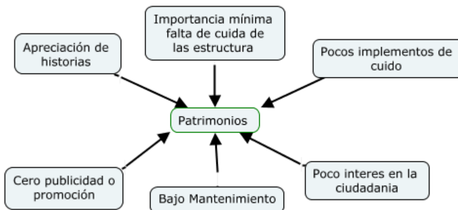
Figura 2. Nivel de importancia se le da a los patrimonios arquitectónicos.