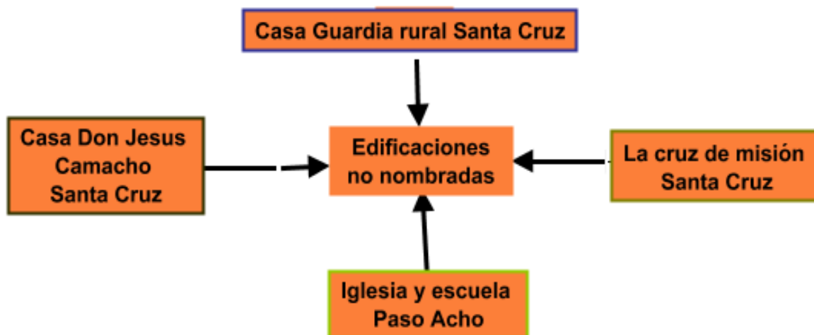
Figura 1. Motivos de visita estructuras Santa Cruz