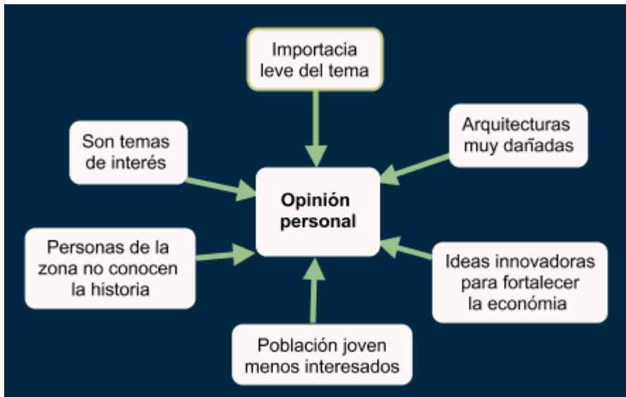
Figura 4: Comentarios.