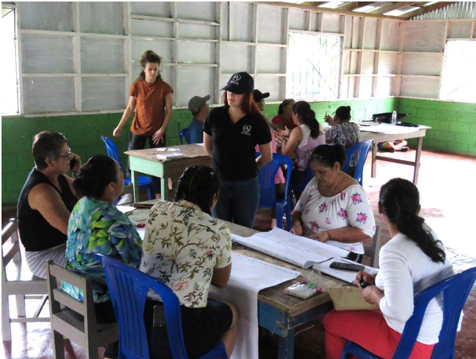
Figura 9. Exposición de uno de los grupos de trabajo en el análisis de manejo poscosecha y valorar las opciones de valor agregado