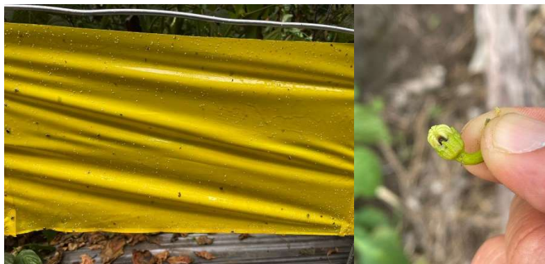
Apéndice 4. Colocación de trampas y trabajo en finca. El Yas, Paraíso