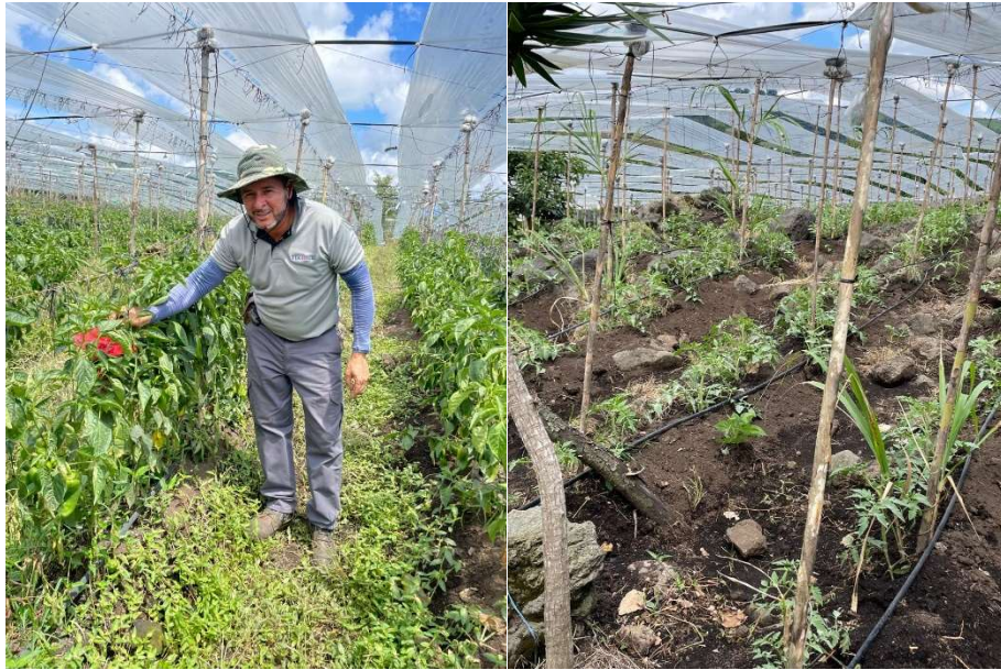
Apéndice 5 Colocación de trampas La Flor de Paraíso