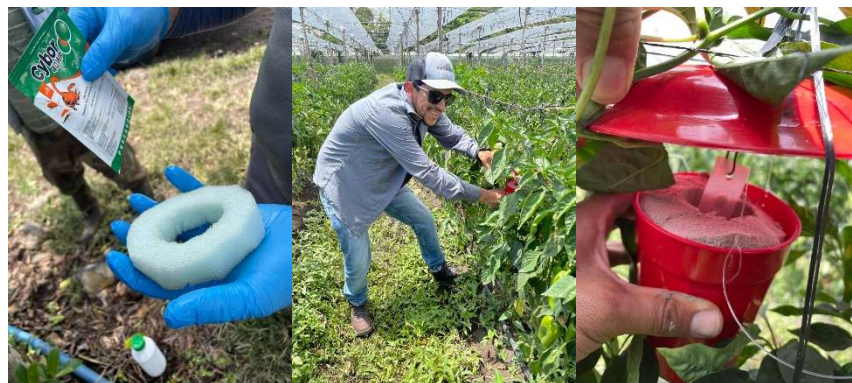
Apéndice 3. Instalación de trampas en Cervantes de Cartago