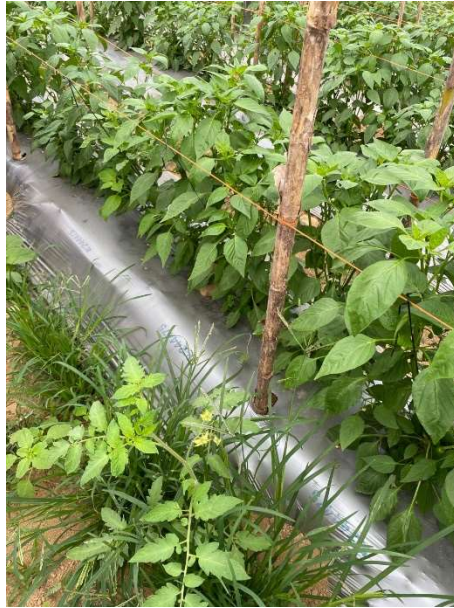
Apéndice 1. Plantas voluntarias de tomate hospederas del picudo