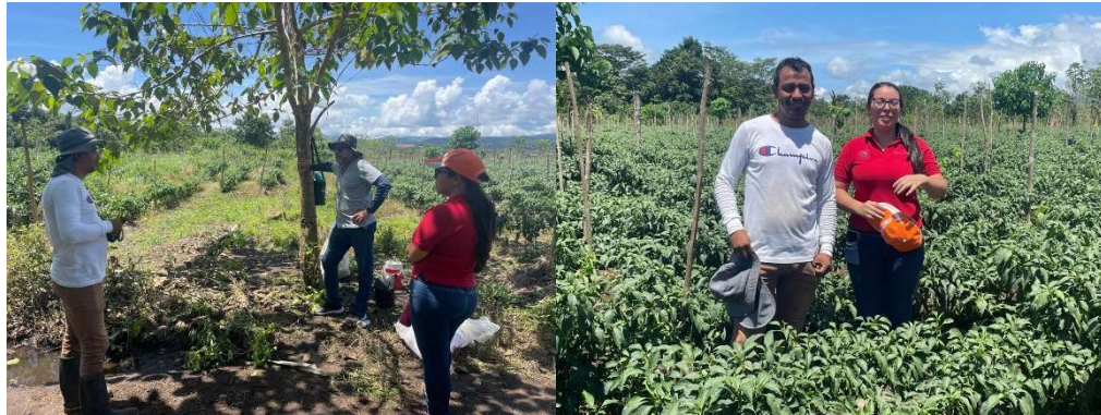
Apéndice 2. Trabajo con Productor de chile picante en Buenos Aires de Puntarenas