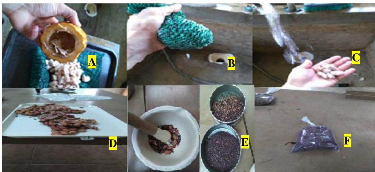
Figura 1. Preparación de las muestras de las semillas de cacao en laboratorio. Extracción de semillas y eliminación de placenta (A), eliminación de mucílago de la semilla (B), lavado de muestra (C), secado del grano (D), molido del grano y tamizado (E), empacado e identificación de la muestra (F).

De las mazorcas cosechadas se extrajeron las semillas, se procedió a eliminar la placenta y el mucílago que posee la semilla, luego se lavó con agua, se procedió a mezclar y por último se introdujeron en el horno a una temperatura de 60°C y aire forzado durante 96 horas, se procedió al molido de las semillas con las cáscarillas mediante la utilización de un mortero y pistilo para luego tamizarlas. Una vez obtenida la muestra final se procedió a enviarla al CIA de la UCR, en donde se realizó un análisis para determinar el cadmio (Figura 1).