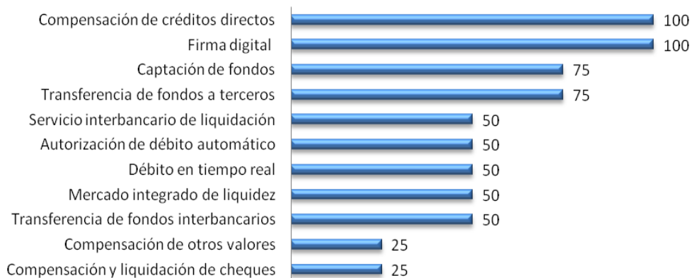
Gráfico 1: Servicios SINPE que responden a las necesidades de las Asociaciones Solidaristas, abril 2013 (valores absolutos).

Los principales servicios SINPE que se ajustan a las necesidades de las Asociaciones Solidaristas son compensación de créditos directos, firma digital, captación de fondos y transferencias de fondos a terceros (Gráfico 1). Las transferencias a terceros junto con los débitos directos en tiempo real fueron los servicios de mayor uso por parte de los usuarios SINPE en general durante el 2012.