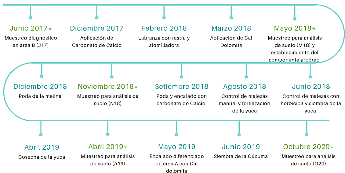
Figura 2. Línea de tiempo de las actividades realizadas en el área de estudio, Pital, San Carlos, Costa Rica.

A los cuatro y a los siete meses de establecido el componente arbóreo se realizó una poda de formación y se dejaron los residuos de la poda en el sitio. En diciembre del 2017 se aplicó 1 Mg/ha de carbonato de calcio en el área B, seis meses antes de plantar se realizó una aplicación de 1 Mg/ha de carbonato de calcio en la totalidad del área y al momento del establecimiento se aplicó 1 Mg/ha de carbonato de calcio y magnesio, conocida como cal dolomita en la totalidad del área, igualmente, antes del establecimiento.