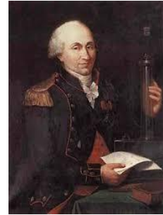
Charles-Agustin de Coulomb Francia (1736-1806)

La interacción eléctrica entre dos objetos puede describirse mediante la fuerza eléctrica que ejerce uno sobre el otro. Entre 1784 y 1785, el científico francés Charles-Agustín de Coulomb estudió la fuerza de atracción o repulsión entre dos cargas puntuales , o sea, objetos de dimensiones muy pequeñas comparadas con la distancia que los separa. Coulomb propuso una expresión que relaciona las magnitudes de las cargas y la distancia que las separa. La expresión de la magnitud de la fuerza entre dos cargas puntuales es,