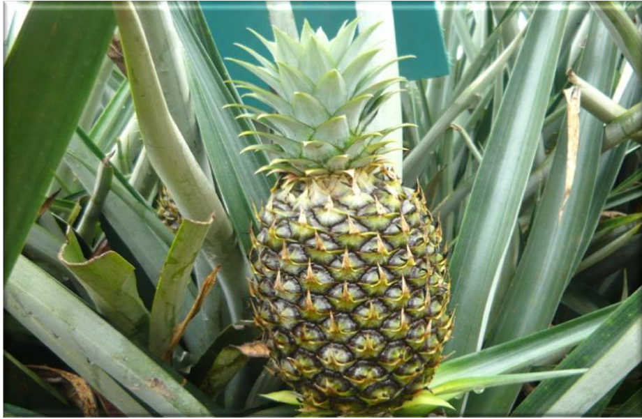
Figura 15. Crecimiento de fruta 105 ddf. Fruta con corona casi desarrollada, frutículos parcialmente desarrollados con pigmentación verde-morado, Finca Piñales las Delicias, Méndez G. 2009.