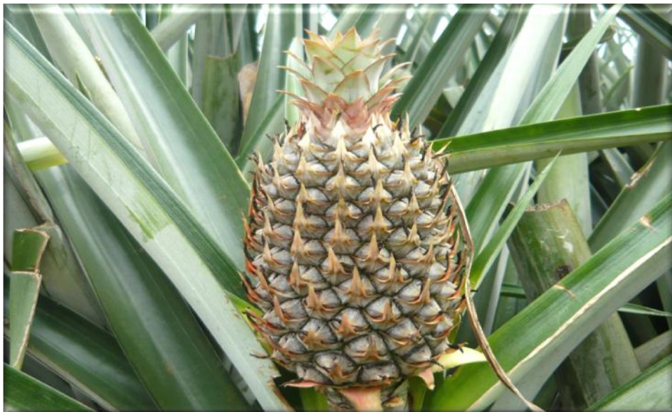
Figura 10. Crecimiento de fruta 80 ddf. Frutículos definidos. Finalización de floración (flor totalmente seca), Finca Piñales las Delicias, Méndez G. 2009.