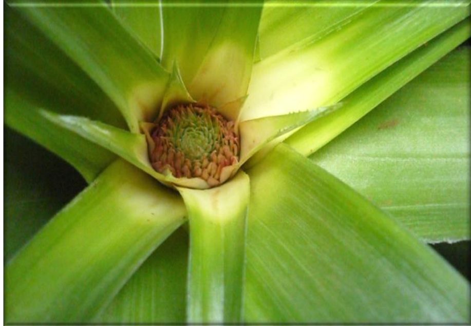
Figura 3. Crecimiento de fruta 45 días después de floración (ddf). Brácteas verdes sin frutículos definidos, Finca Piñales las Delicias, Méndez G. 2009.