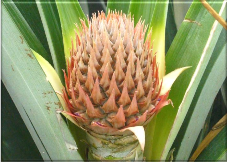
Figura 5. Crecimiento de fruta 55 ddf. Brácteas totalmente rosadas. Sin frutículos definidos, Finca Piñales las Delicias, Méndez G 2009.