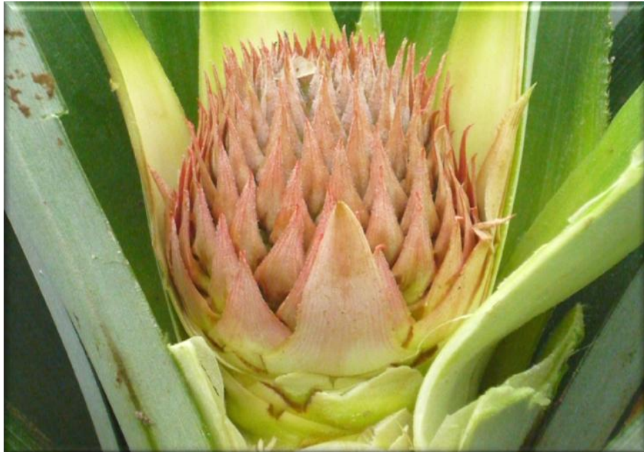
Figura 4. Crecimiento de fruta 50 ddf. Brácteas superiores rosadas e inferiores verdes. Sin frutículos definidos, Finca Piñales las delicias, Méndez G. 2009.