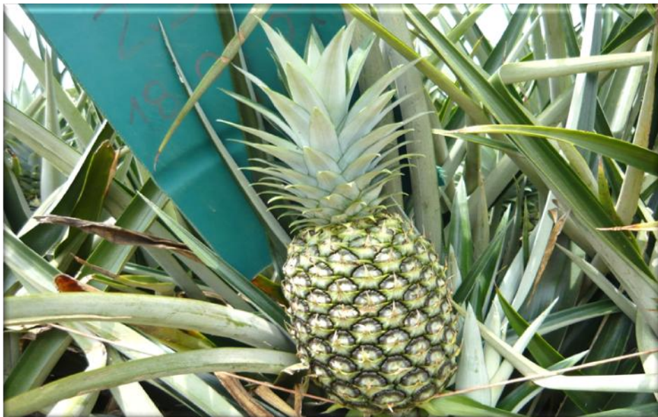
Figura 22. Crecimiento de la fruta 140 ddf. Fruta con corona totalmente desarrollada, fruta parcialmente verde, inicia pigmentación amarilla en la base de la fruta, Finca Piñales las Delicias, Méndez G. 2009.