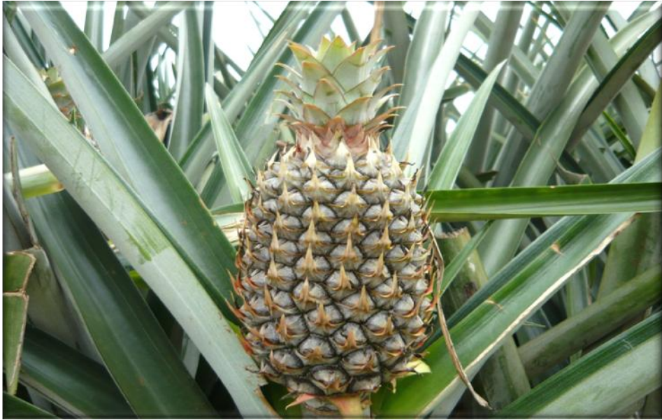
Figura 11. Crecimiento de fruta 85 ddf. Floración seca frutículos rojizos corona en formación, Finca Piñales las Delicias, Méndez G. 2009