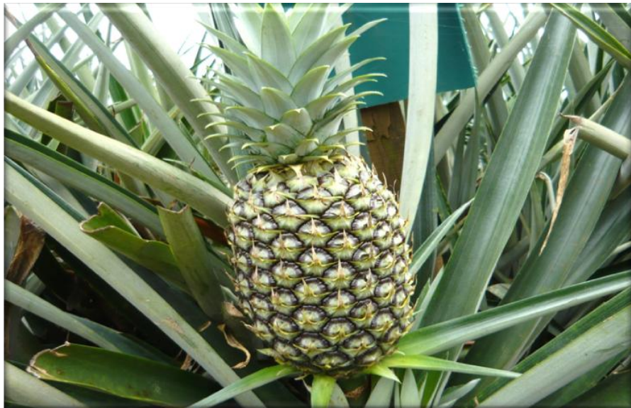
Figura 18. Crecimiento de la fruta 120 ddf. Fruta con corona casi desarrollada, frutículos parcialmente desarrollados con pigmentación verde-oscuro, Finca Piñales las Delicias, Méndez G. 2009.