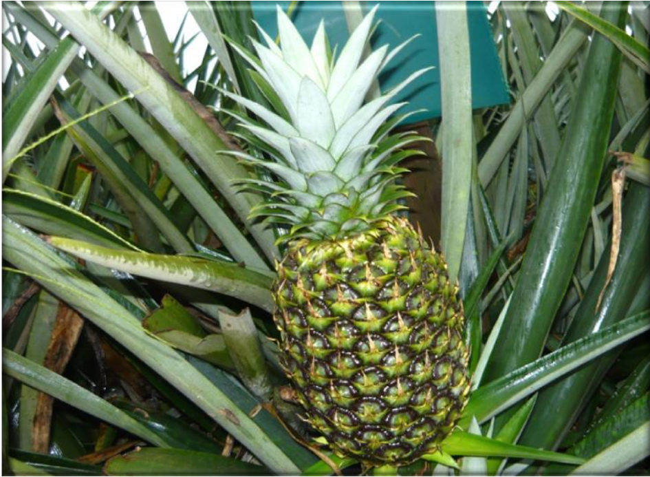
Figura 19. Crecimiento de la fruta 125 ddf. Fruta con corona desarrollada, frutículos parcialmente desarrollados con pigmentación verde-oscuro, Finca Piñales las Delicias, Méndez G.2009.