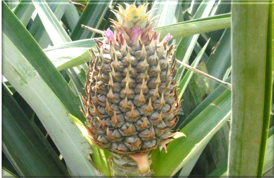
Figura 9. Crecimiento de fruta 75 ddf. Frutículos definidos. Finalización de floración (flor alta), Finca Piñales las Delicias, Méndez G. 2009.