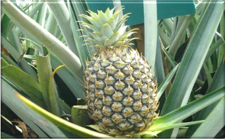
Figura 13. Crecimiento de fruta 95 ddf. No hay flores y los frutículos son verdes corona casi desarrolla, Finca Piñales las Delicias, Méndez G. 2009.