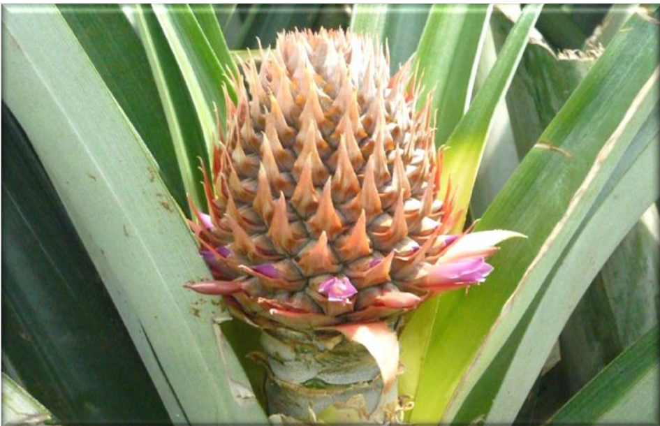
Figura 6. Crecimiento de fruta, 60 ddf. Frutículos basales definidos. Inicio de floración, primer cuarto, Finca Piñales las Delicias, Méndez G. 2009.