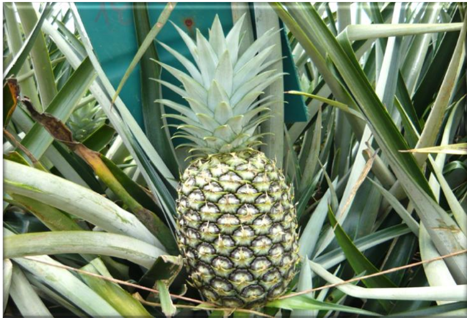
Figura 20. Crecimiento de la fruta 130 ddf. Fruta con corona desarrollada, frutículos totalmente desarrollados con pigmentación verde, Finca Piñales las Delicias, Méndez G. 2009