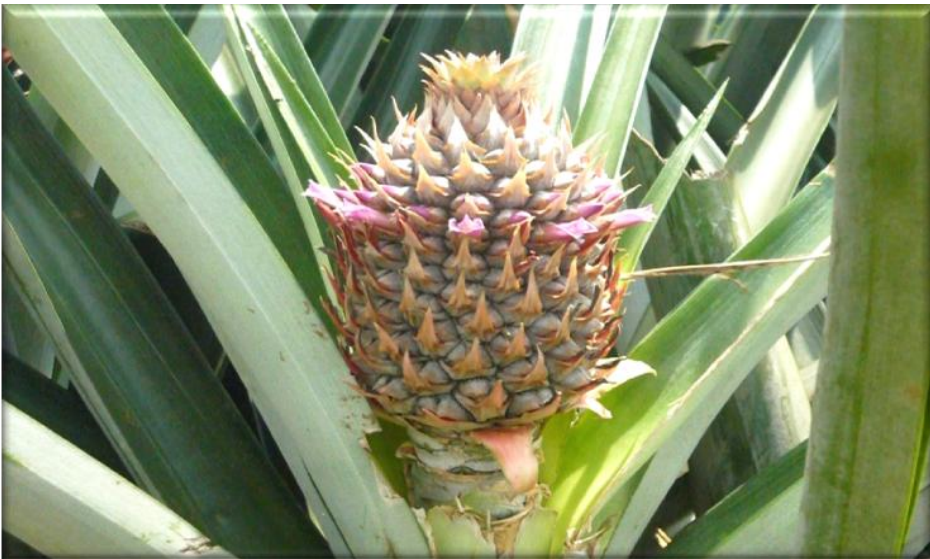
Figura 8. Crecimiento de fruta, 70 ddf. Frutículos definidos. Floración en el tercer cuarto, Finca Piñales las Delicias, Méndez G. 2009