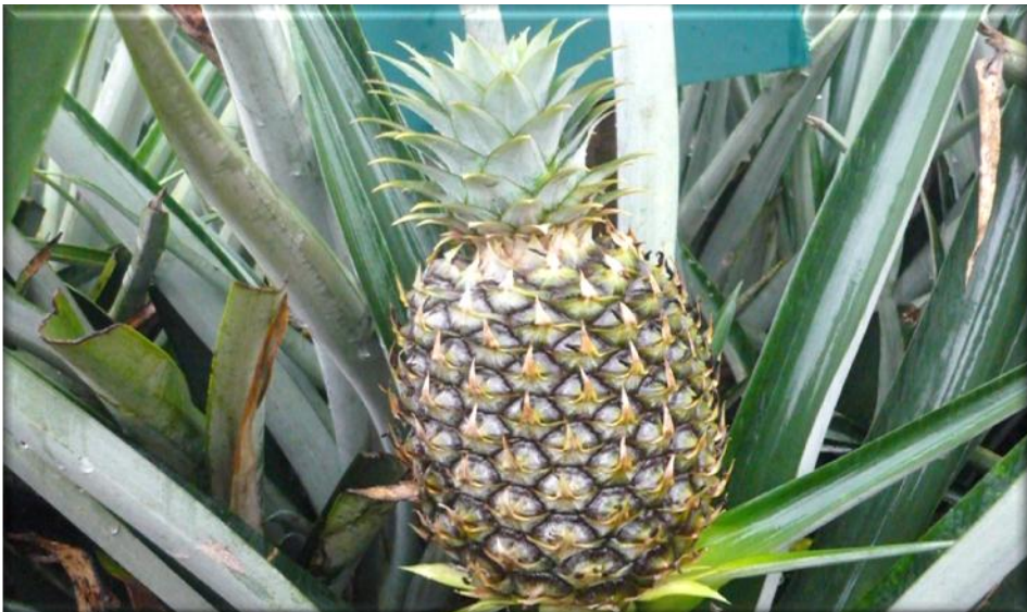
Figura 14. Crecimiento de fruta 100 ddf. Frutículos son verdes corona casi desarrolla, Finca Piñales las Delicias, Méndez G. 2009.