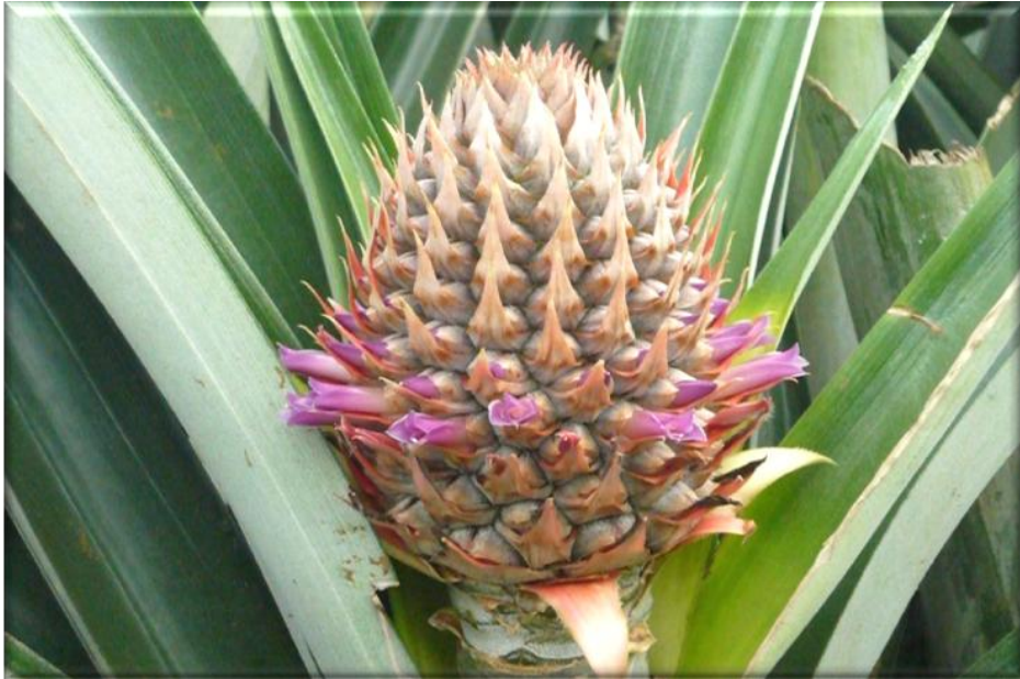
Figura 7. Crecimiento de fruta, 65 ddf. Frutículos definidos. Floración en segundo cuarto inferior, Finca Piñales las Delicias, Méndez G. 2009.