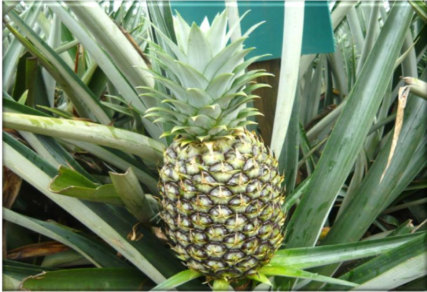
Figura 17. Crecimiento de la fruta 115 ddf. Fruta con corona casi desarrollada, frutículos parcialmente desarrollados con pigmentación verde-oscuro, Finca Piñales las Delicias, Méndez G. 2009.