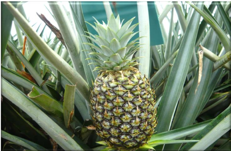
Figura 16. Crecimiento de la fruta 110 ddf. Fruta con corona casi desarrollada, frutículos parcialmente desarrollados con pigmentación verde-morado, Finca Piñales las Delicias, Méndez G. 2009