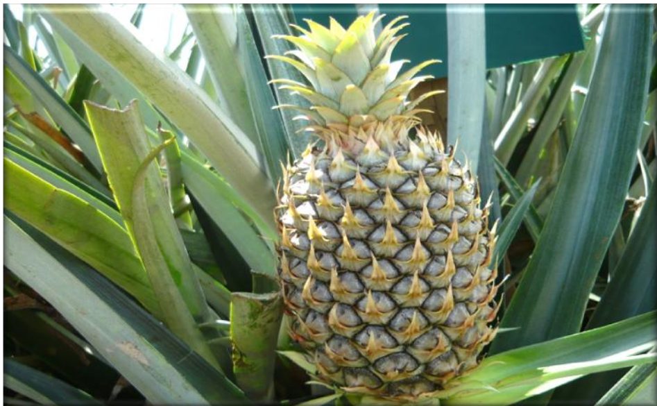
Figura 12. Crecimiento de fruta 90 ddf. Floración seca frutículos verdes corona en desarrollo, Finca Piñales las Delicias, Méndez G.2009.