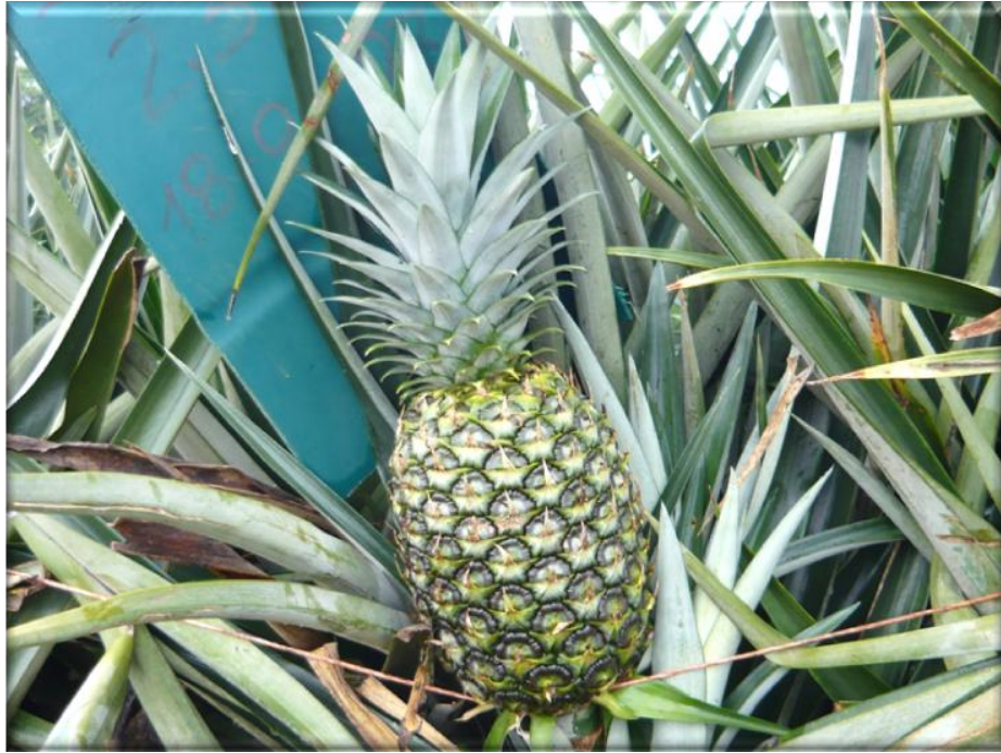
Figura 23. Crecimiento de la fruta 145 ddf. Fruta con corona totalmente desarrollada, parcialmente verde, presenta pigmentación amarilla en la base de la fruta, Finca Piñales las Delicias, Méndez G. 2009..