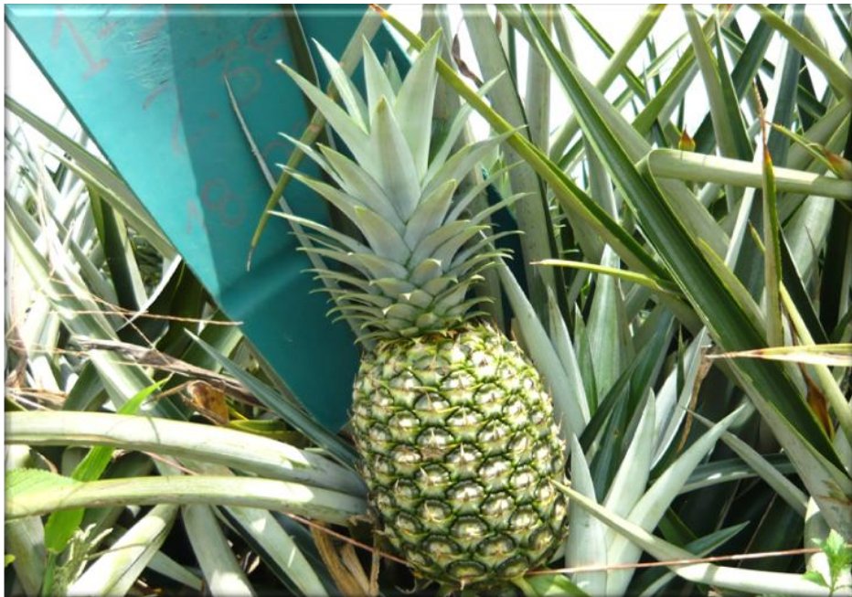
Figura 24. Crecimiento de la fruta 150 ddf. Fruta con corona totalmente desarrollada, quiebre de color evidente, la mayoría de los ojos muestran un 20 % de su área con color amarillo, Finca Piñales las Delicias, Méndez G. 2009.