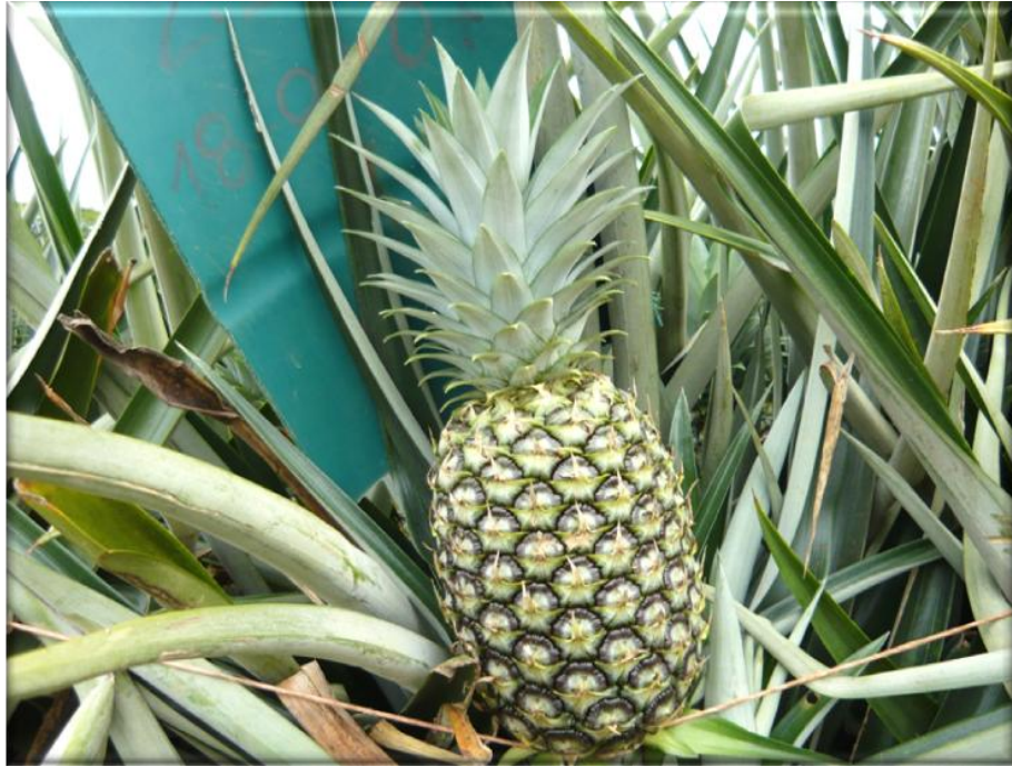
Figura 21. Crecimiento de la fruta 135 ddf. Fruta con corona desarrollada, fruta totalmente verde, Finca Piñales las Delicias, Méndez. G. 2009.