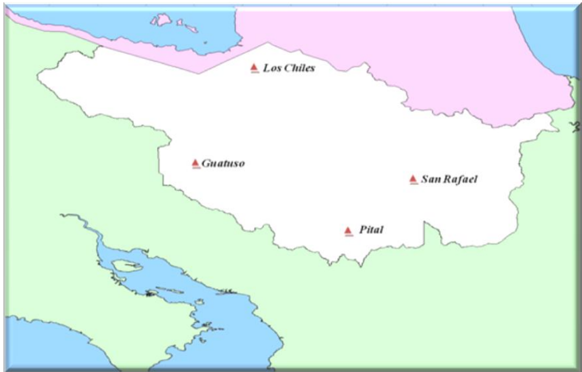
Figura 1. Ubicación de los diferentes puntos de muestreo donde se realizó los diferentes muestreos, para determinar la incidencia de floración natural en piña, variedad MD-2.

El estudio se realizó en la Región Huetar Norte, específicamente en las zonas de Guatuso, Pital, Los Chiles y San Rafael de Rio Cuarto de Grecia (Figura 1).