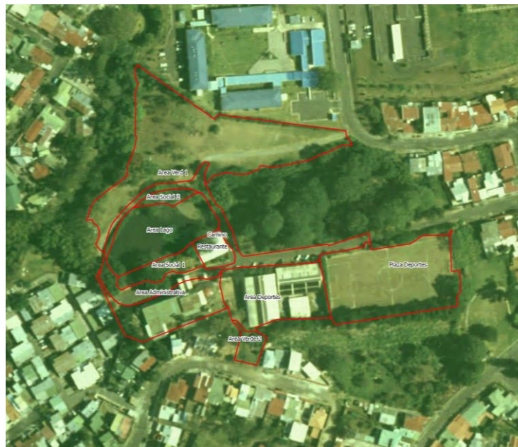
Figura 1. Diagrama de los límites organizacionales del Colegio de Ingenieros Agrónomos de Costa Rica para el inventario de GEI 2012.