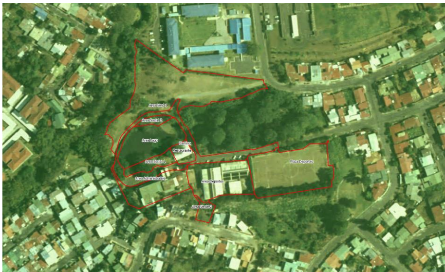
Figura 2. Diagrama de los límites organizacionales del Colegio de Ingenieros Agrónomos de Costa Rica para el inventario de GEI 2012.