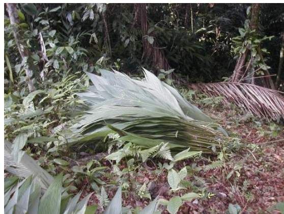
Figura 3. Rollo de 500 hojas de Asterogyne martiana listo para ser amarrado y transporte al sitio de construcción.

Posteriormente se inicia la recolección de estos grupos de hojas que son llevados a sitios cercanos al camino, donde se realiza la selección de las hojas. La preparación final consiste en cortar el pecíolo de la lámina de un tamaño uniforme y realizar una preselección de las hojas a fin eliminar las dañadas o defectuosas, luego se agrupan estas en rollos de 500 hojas que son amarradas con bejucos que se obtienen del mismo bosque.