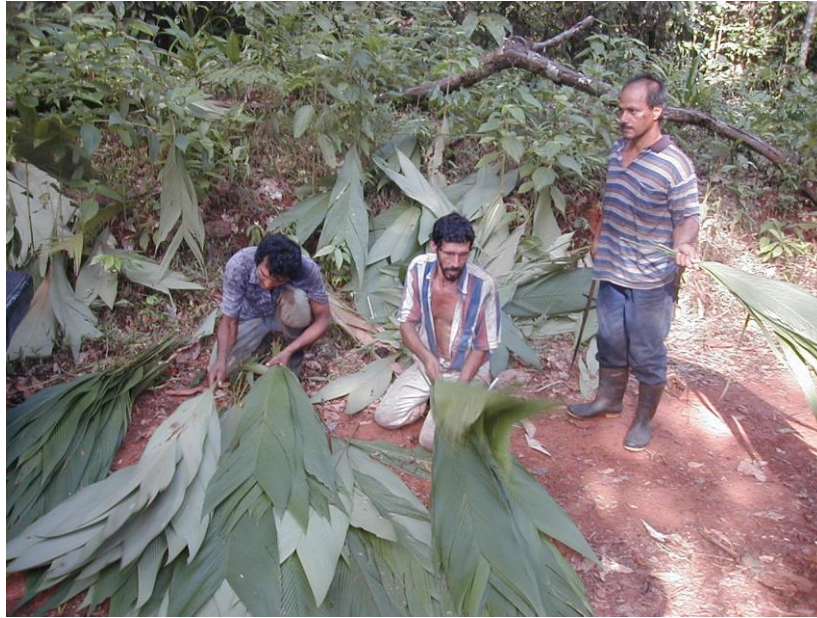
Figura 2. Preparación y elaboración de rollos de Asterogyne martiana , para su transporte.

Posteriormente se inicia la recolección de estos grupos de hojas que son llevados a sitios cercanos al camino, donde se realiza la selección de las hojas. La preparación final consiste en cortar el pecíolo de la lámina de un tamaño uniforme y realizar una preselección de las hojas a fin eliminar las dañadas o defectuosas, luego se agrupan estas en rollos de 500 hojas que son amarradas con bejucos que se obtienen del mismo bosque.