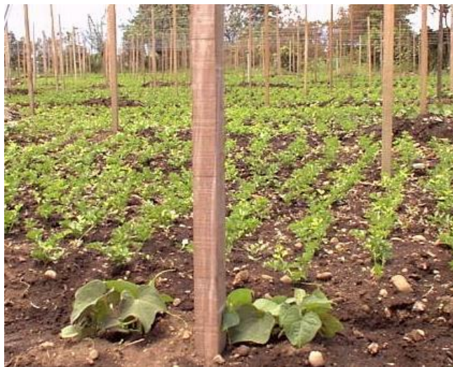
Figura 11. Plantas de chayote ( Sechium edule ) producidas in vitro y sembradas en condiciones de campo.

Una vez aclimatadas las plantas y desarrolladas en invernadero, se trasladan a un terreno aislado de las siembras comerciales de chayote, acorde a lo estipulado en el Reglamento técnico de certificación de semilla (ONS).