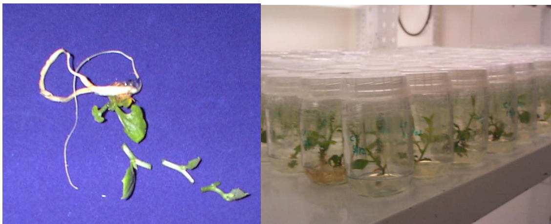
Figura 4. Multiplicación in vitro de chayote ( Sechium edule ). Nótese los cortes en los entrenudos para cultivar microestacas de un nudo y desarrollar plántulas.