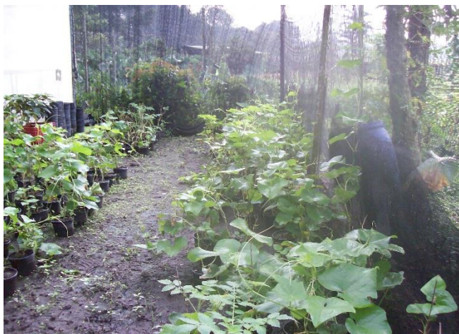
Figura 9. Plantas de chayote en sombreador bajo sarán