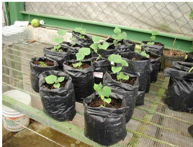
Figura 8. Vitroplantas de chayote ( Sechium edule ) cultivadas en bolsa