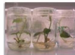
Fotografía: Plantas de chayote in vitro .