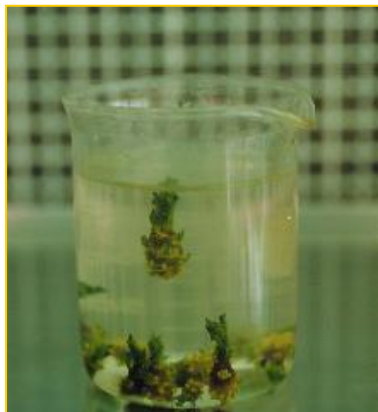
Figura 2. Brotes de chayote ( Sechium edule ) en solución desinfectante.

Se procede a reducir los brotes eliminando las hojas más externas, de manera que se establece in vitro el meristema incluyendo dos o tres pares de hojas, por frasco de cultivo.