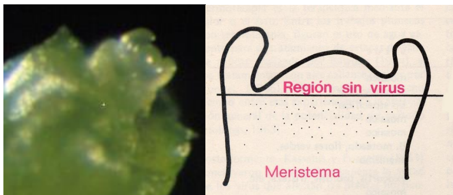
Figura 6. Brote de chayote ( Sechium edule ) mostrando el domo apical y los primordios foliares. Domo apical libre de virus.

Por otra parte, el cultivo de meristemas se fundamenta en que la distribución de los virus en los tejidos de una planta infectada no es uniforme y que su concentración tiende a disminuir progresivamente hacia el meristema apical del tallo, donde las células se encuentran en constante división celular. La ausencia de tejido vascular en la proximidad del meristema apical y la activa división celular que allí ocurre ayudan a explicar la ausencia de partículas virales. Todas estas técnicas de erradicación de virus han sido experimentadas en chayote para eliminar el virus del mosaico del chayote (ChMV) (Abdelnour-Esquivel et al. 2006).