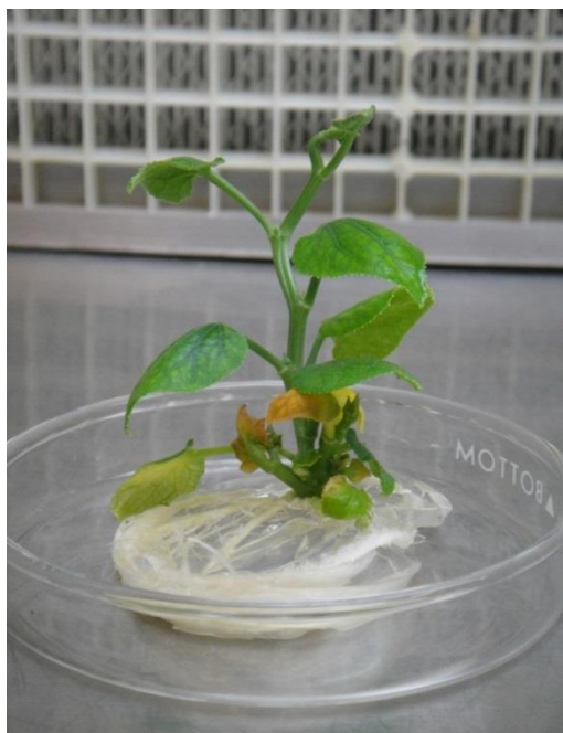
Figura 5. Planta de chayote ( Sechium edule ) desarrollada in vitro . Nótese el desarrollo de raíces.