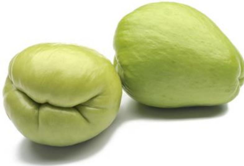
Figura 12. Frutos de chayote ( Sechium edule ) mostrando las características deseadas para comercialización.

Se procede a la eliminación de plantas, que no sean fieles representantes de la variedad Quelite, estableciendo un banco de semilla, de esta variedad.