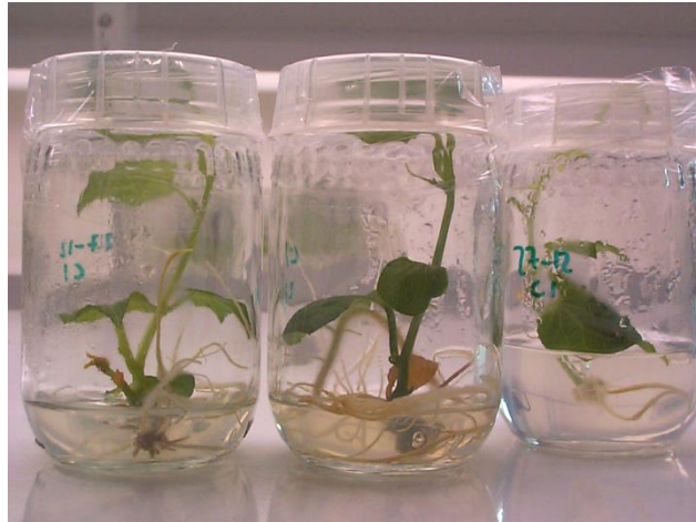
Figura 7. Vitroplantas de chayote ( Sechium edule ) mostrando un tamaño y desarrollo de raíces adecuado para iniciar el proceso de aclimatación.