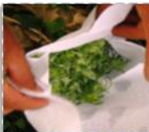
Fotografía: Brotes de chayote utilizados para la multiplicación masiva en el laboratorio