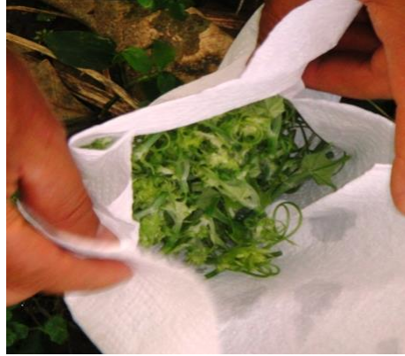
Figura 1. Brotes de chayote ( Sechium edule ) recolectados en la finca y trasladados al laboratorio envueltos en papel toalla húmedo.