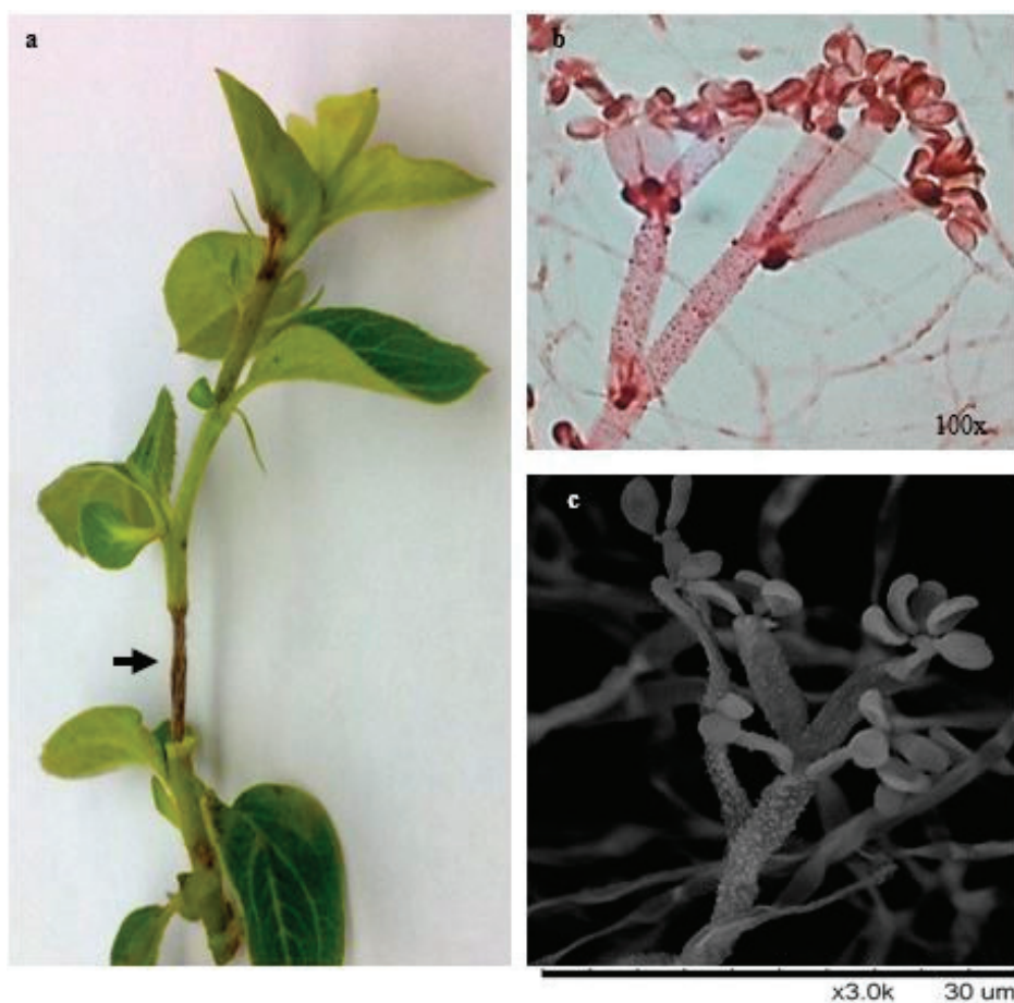
FIGURA 2- Planta de membrillo ( Cydonia oblonga ) infectada e identificación de esporas fúngicas. (a) Estrangulamiento del tallo de membrillo por ataque fúngico. Conidióforos del hongo causante del estrangulamiento del tallo visto en microscopía óptica (b), y en MEB (c).